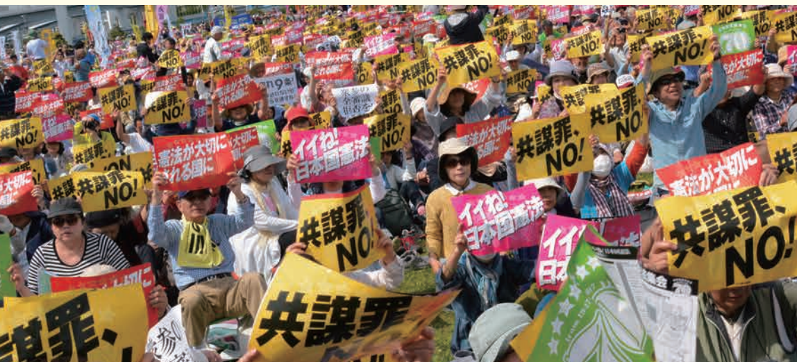
2017年「施行70年、いいえ！日本国憲法5・3集会」5万5000人参加（東京・有明防災公園）

“安倍9条改憲”反対の一点で手をつなぎましょう。3000万人の「戦争はイヤだ」の声を集めて、9条を未来につないでいきましょう。