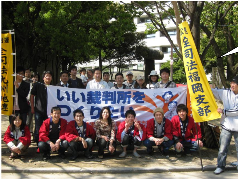
メーデーで奮闘する 福岡支部

全司法大運動の趣旨を多くの国民に伝えるためにも、職場内のみでなく幅広い人達に呼びかけて宣伝しましょう！