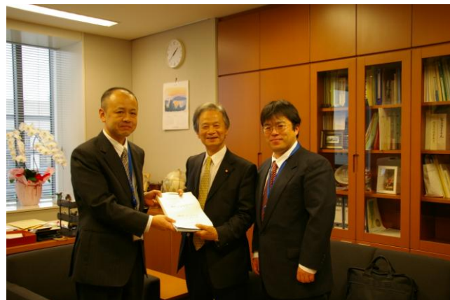
民主党：江田参議院議員（2010年）