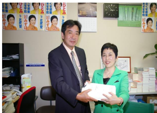
社会民主党：福島参議院議員（2007年）