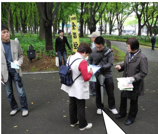
街頭署名活動で奮闘する 愛知支部