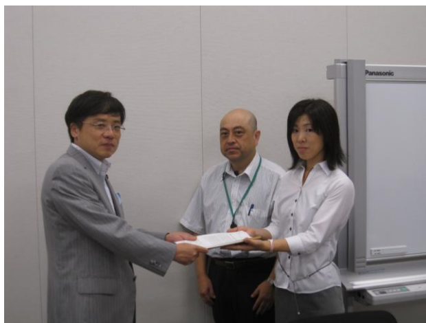
日本共産党：井上参議院議員（2011年）

全司法大運動では、多くの議員が紹介議員になっており、政党別では民主党から日本共産党まで全政党から紹介議員になっていただいています。