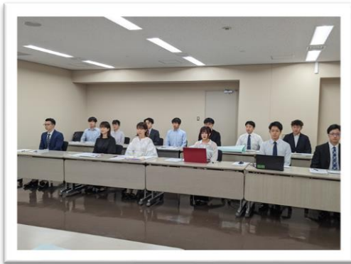
オブザーバーを含め13名で交渉に臨みました！