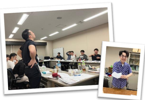
会議はとっても賑やか(*^^*)