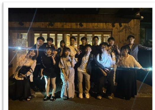
会議後はみんなでご飯 🍴