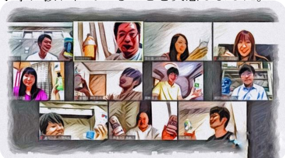
常任委員会後は オンライン懇親会を開催