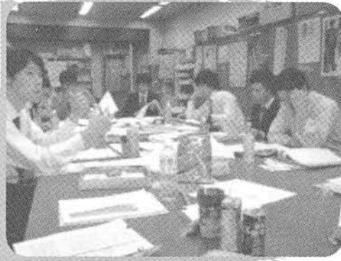
…んで、これが会議風景