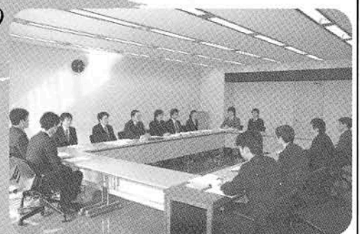
…んで、これが交渉風景 相手は給与課長なり