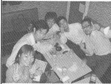
青年だけに 三次会ですな。

昨年度に行われた青年協議長杯ボーリング大会の結果は、総合優勝が三重支部で第2位が札幌支部、第3位に秋田支部がランクインしました。入賞した青年部の皆さん、おめでとうございます。 今回は、受賞された青年部よりヨロコビの声をいただきます。おめでとうございます！