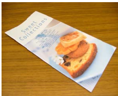
おいしいクッキーはいかが？